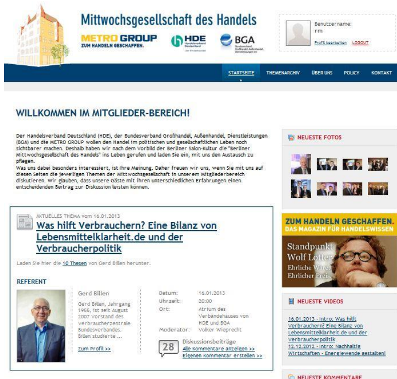
Abbildung 2: Benutzeroberfläche des Mitgliederbereichs der Internetseite www.berlinermittwochsgesellschaft.de

Nach dem Vorbild der Berliner Salon-Kultur hat die METRO GROUP in Zusammenarbeit mit dem Handelsverband Deutschland (HDE) im Frühjahr 2010 die „Berliner Mittwochsgesellschaft des Handels“ ins Leben gerufen ( www.berliner-mittwochsgesellschaft.de ). Inzwischen ist neben dem HDE auch der Bundesverband Groß- und Außenhandel (BGA) Kooperationspartner der METRO GROUP bei dieser Veranstaltungsreihe. Durch inhaltliche Debatten mit besonderem Dialogcharakter soll aufgezeigt werden, wie vielfältig, innovativ und leistungsstark die Welt des Handels ist und wie Themen, die den Handel bewegen, große Relevanz für viele Bereiche von Politik, Wirtschaft und Gesellschaft haben. Entscheidend für das Format ist, dass die Themen des Abends im Vorfeld schon online in einem passwortgeschützten und moderierten Bereich diskutiert und im Nachhinein dort auch reflektiert werden. In solchen Formaten ist es für die METRO GROUP und die Teilnehmer aus Politik und Gesellschaft möglich, Themen zu erkunden, die außerhalb des eigenen Verantwortungsbereichs liegen, aber künftig das Geschäft und die Gesellschaft beeinflussen werden. Diese Diskussionsrunde wird durch Verwendung von Web 2.0-Formaten intensiver, qualitativ hochwertiger und ermöglicht einen schnellen und produktiven Wissensaustausch, der die Transparenz und somit die Glaubwürdigkeit einer verantwortungsvollen Interessenvertretung unterstützt.